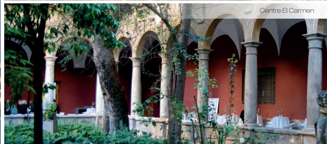
Centre El Carmen