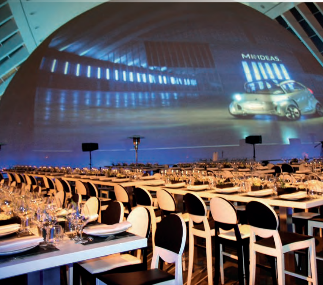
Presentación Mundial Peugeot 508