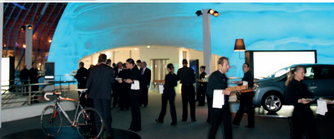
Cenas de Gala