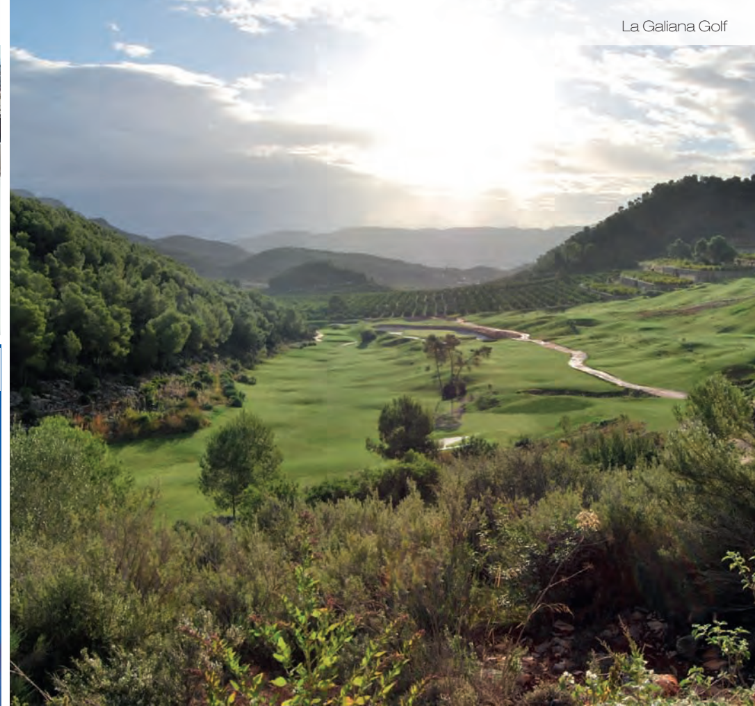
La Galiana Golf