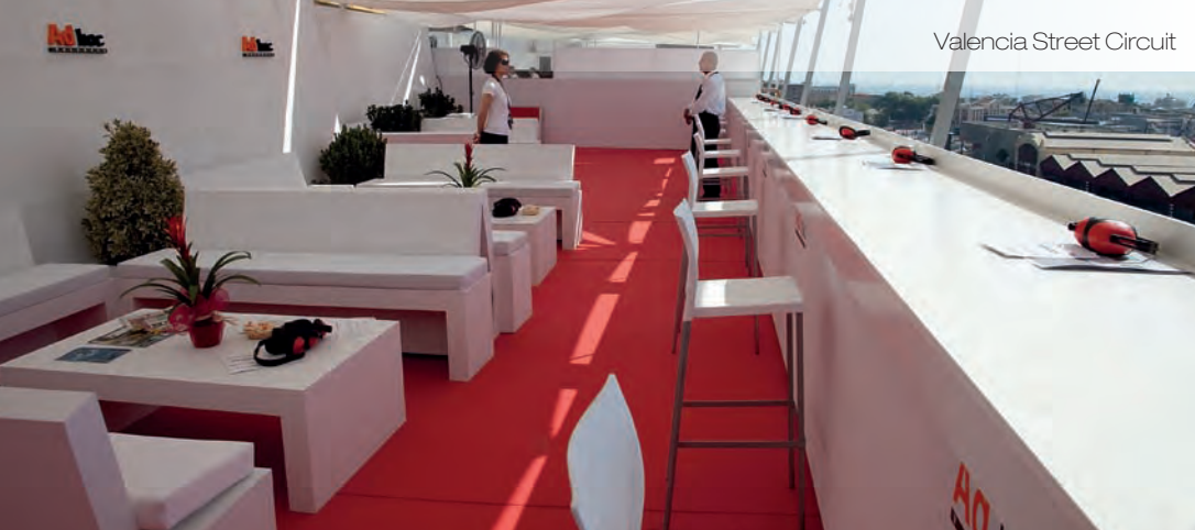
Valencia Street Circuit