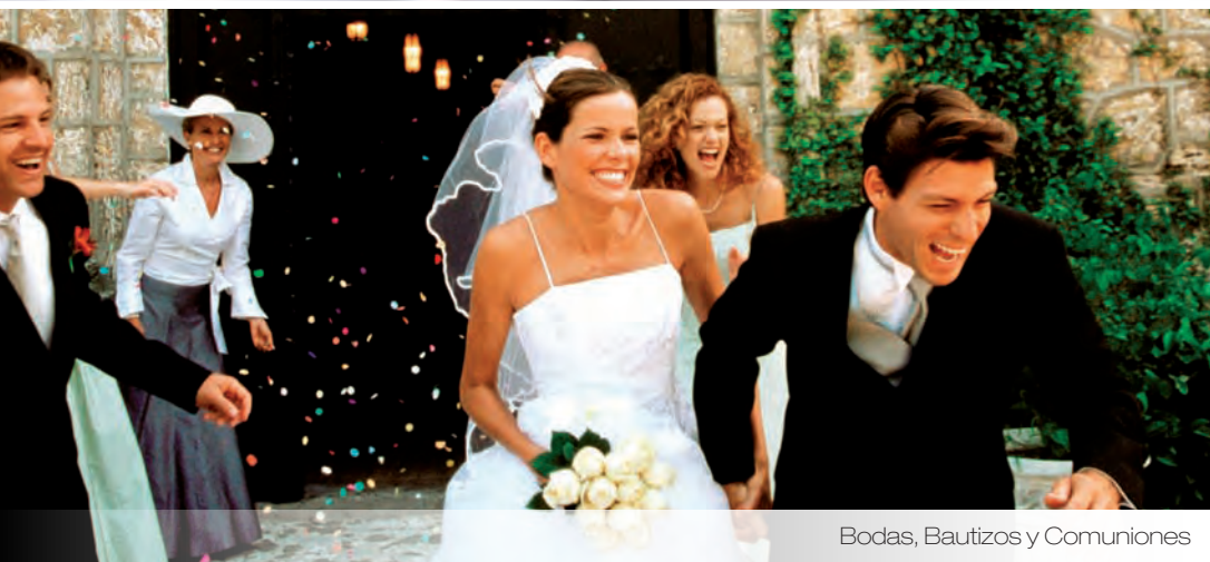
Bodas, Bautizos y Comuniones