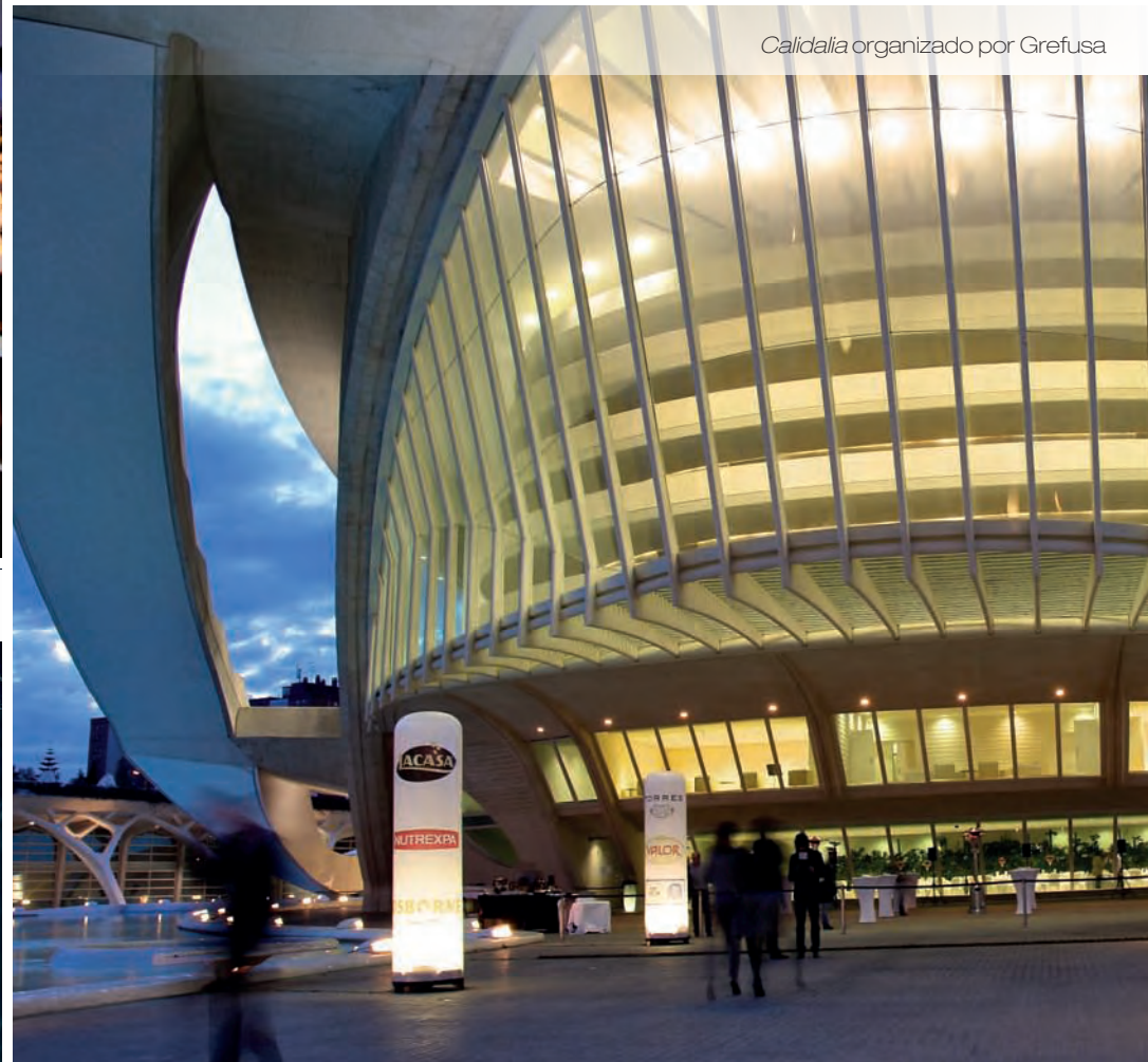
Calidalia organizado por Grefusa