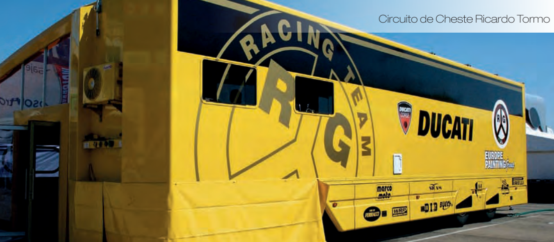
Veles e Vents