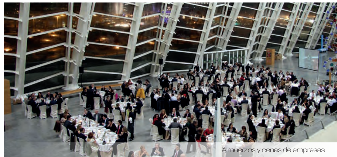
Almuerzos y cenas de empresas